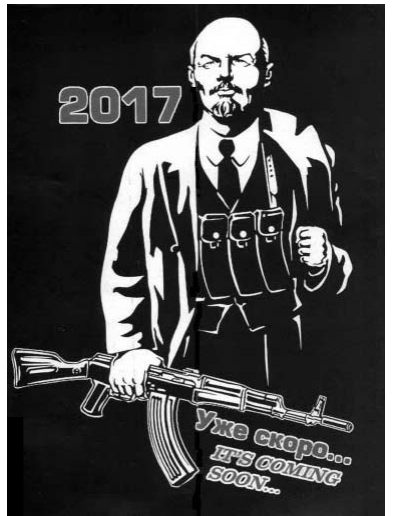
Тулня страница журнала «North Star Compass» (ноябрь-декабрь 2011 года)