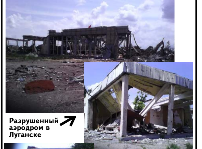
Разрушенный аэродром в Луганске