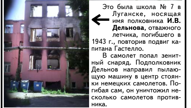
← Это была школа № 7 в Луганске, носящая имя полковника И.В. Дельнова , отважного летчика, погибшего в 1943 г., повторивший подвиг капитана Гастелло.

В самолет попал зенитный снаряд. Подполковник Дельнов направил пылающую машину в центр стоянки немецких самолетов. Погиб сам, он уничтожил несколько самолетов противника.