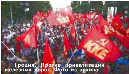
Греция. Против приватизации железных дорог.