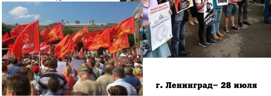
г. Ленинград – 28 июля

Плакаты: Живи быстрее, умри молодым Зачем мертвецу пенсия? Деньги есть, да не про вашу честь И др.