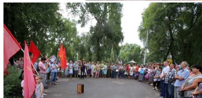
г. Москва – 18 июля

Плакаты: Живи быстрее, умри молодым Зачем мертвецу пенсия? Деньги есть, да не про вашу честь И др.