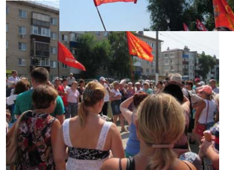
г. Воронеж – 11 июля