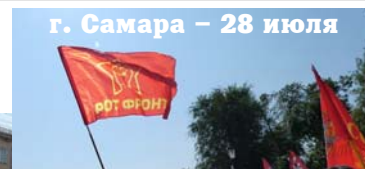
г. Самара – 28 июля