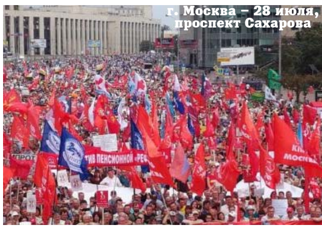
г. Москва – 28 июля, проспект Сахарова

рять здесь с людьми со всех концов страны.