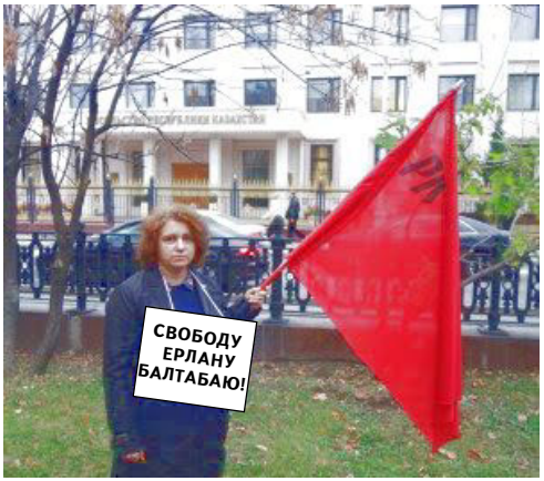
Президенту республики Казахстан Касым-Жомарту Токаеву