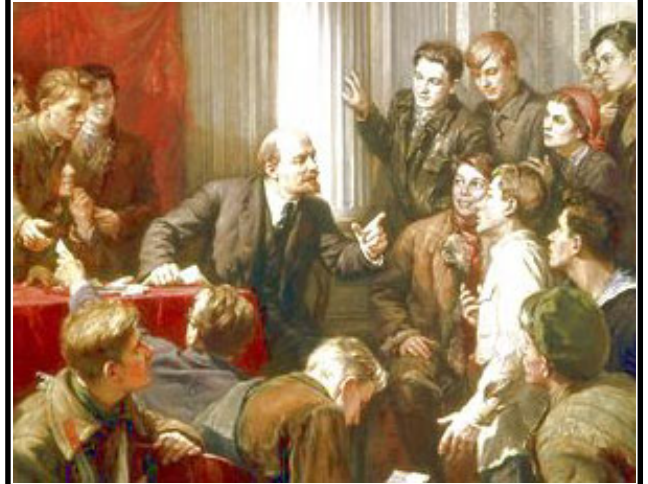
В.И. Ленин среди делегатов III Съезда комсомола (фрагмент картины, худ. П.П. Белоусов)

К 100-летию Коммунистического Интернационала молодежи (КИМ)