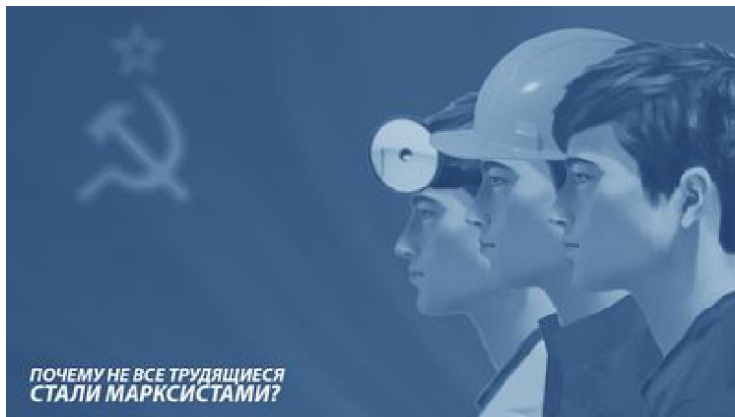
ПОЧЕМУ НЕ ВСЕ ТРУДЯЩИЕСЯ СТАЛИ МАРКСИСТАМИ?